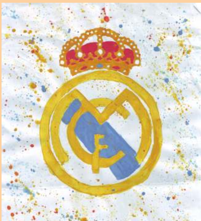
Laura Tafaj, kl. VIII/2