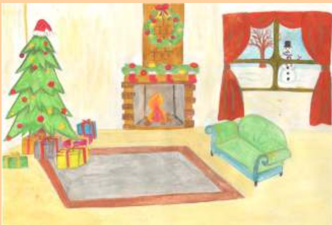
Fitore Selimaj, kl. IX/1