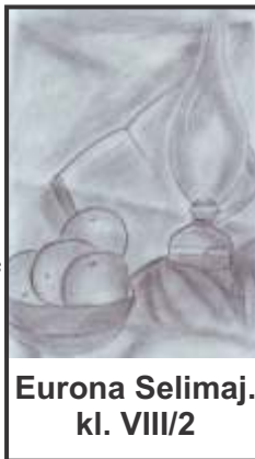
Eurona Selimaj, kl. VIII/2