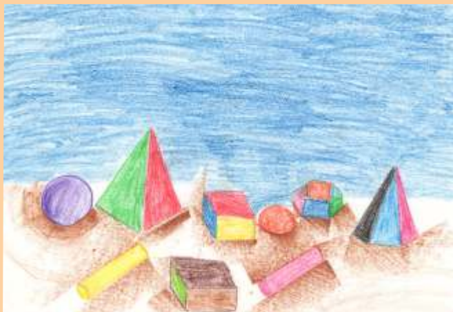
Ardita Kicaj , kl. VII/1